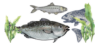
u.a. in fetthaltigen Fischen (Hering, Lachs, Makrele) oder Algen