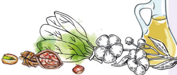
u.a. in Leinöl, Rapsöl, Leinsamen, Chiasamen oder Walnüssen